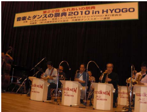
サウンド・ニュージャズオーケストラ