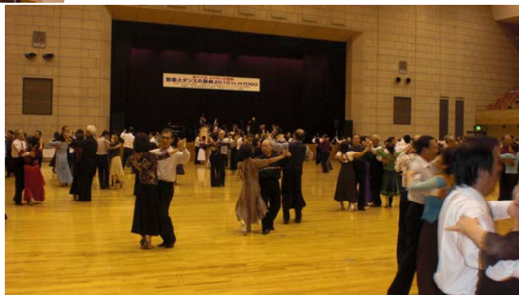
ダンスパーティー